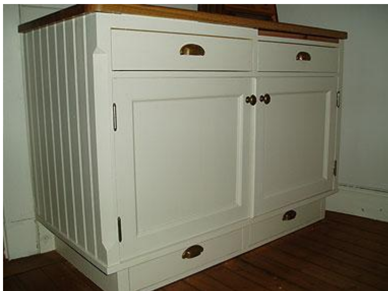
Bänkskåp med pärlspontsida, sockellådor, skärbräda, hörnfas och anslagslist på Luckan.

Ni kan också välja vilken Konsol ni vill ha. Om ni vill ha Dekorlistor på era Skåp och vilken profil. Parlucka kan ha en Anslagslist, ofta med hålkärls-profil. Ni väljer om ni vill ha släta fria skåpsidor, sidor med pärlspont eller kanske sidor med ramverk. Fria skåpsidors hörn, kan ha faser som avslutas med ett ger eller rundning, som är dekorativt.