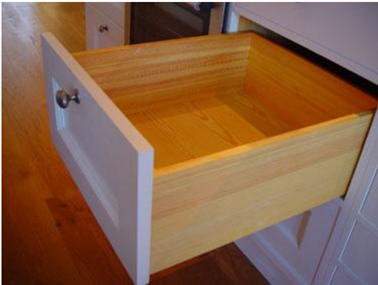
Stor Furulåda med Ramverksfront.

Istället för en vanlig hylla eller trådkorg kan man också ha en utdragslåda av trä. Vi gör en praktisk modell som är öppen framtill.